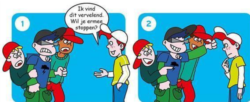
Zeg dat je het niet leuk vindt.

Op social media volg je dezelfde gedragslijn. Met dit verschil dat je hulp kunt inroepen bij meldknop.nl Je doet dat nadat je met je ouders hebt besproken wat er aan de hand is.