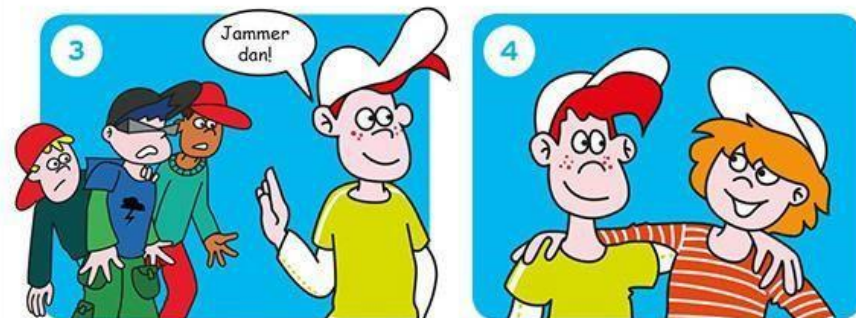
Ga iets anders doen.