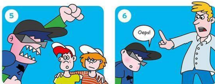
Gaat het door?